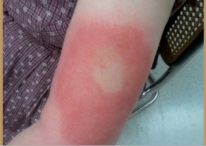
Ein Erythema migrans am Oberarm.