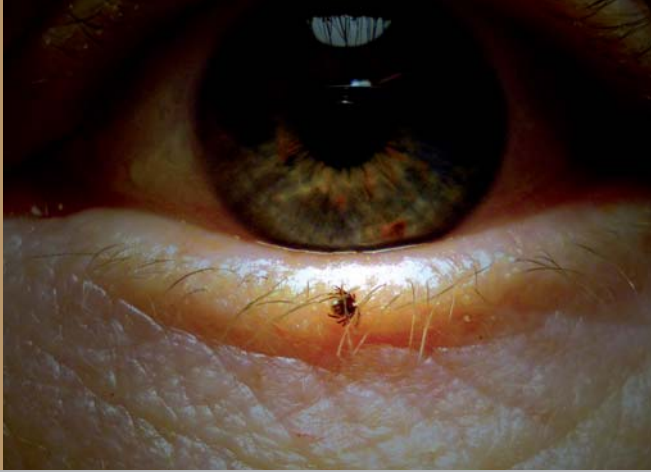
Eine Nympe am Augenlid.